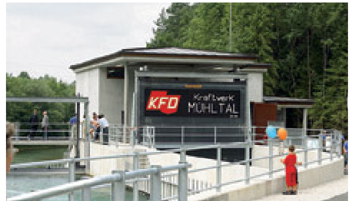
Kraftwerkseröffnung am 8. Juli 2006

D ass das Kraftwerk Mühlal bei Vorchdorf allerdings drei Jahrzehnte brauchen würde, um ans Netz zu gehen, hat sich der Betreiber so nicht vorgestellt. Wenn einem Bürokratie und Anrainer böse mitspielen, kann selbst beste Planung nichts ausrichten. Umso feierlicher beging man kürzlich den großen Tag der Eröffnung mit einem würdigen Fest für das Almtaler Kraftwerk.