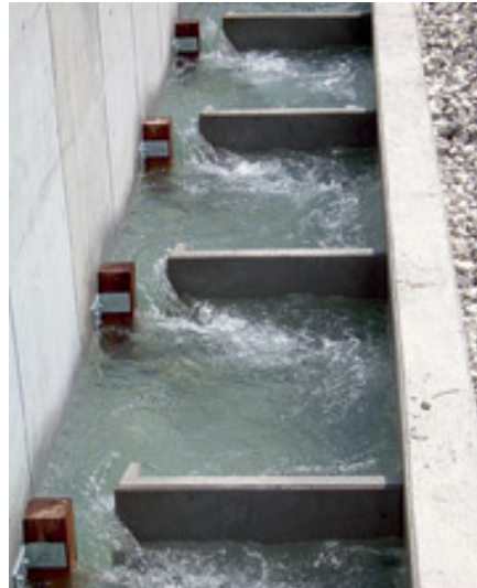
Organismenaufstiegshilfe (Vertical Slot)

wir auch den Grundablass wesentlich verbreitert und die Abflussrampe mit einem legierten Stahlblech verkleidet. Anlagen an der Alm, die auf eine derartige Verkleidung verzichtet haben, wiesen im Nu armdicke Rinnen im Beton, verursacht durch das Geschiebe, auf“, so Drack.