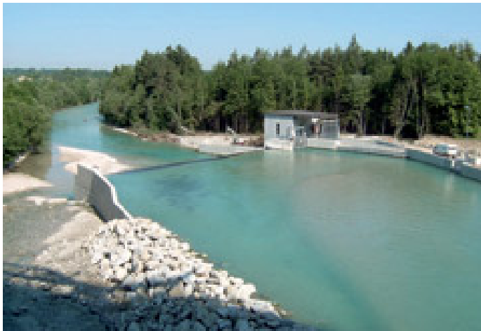
Kraftwerksanlage Mühlalwehr: Blick auf Staubereich

Es dauert manchmal eben ein wenig länger, bis etwas fertig wird: Rom wurde auch