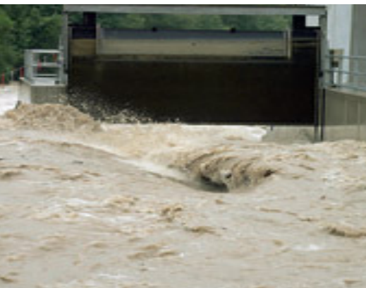
Kraftwerk Mühlthalwehr beim 30-jährigen Hochwasser am 7. August 2006